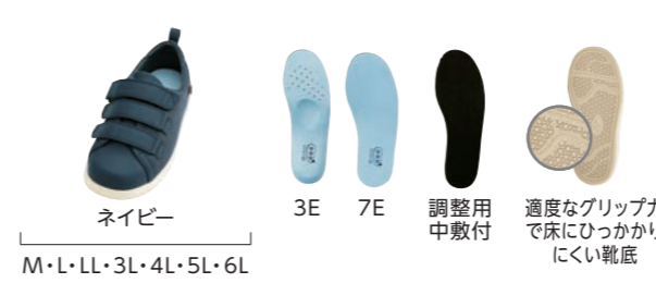
表:ポリエステル100%(メッシュ)、合成皮革 内:ポリエステル100% 底材:EVA樹脂 重さ(片方LLサイズ):[3E]約245g [7E]約255g

標準幅 品番 7502 両足 10,780円 (税抜9,800円) 足囲 3E 片方のみ 5,390円 (税抜4,900円) 幅広タイプ 品番 7503 装具側足囲 7E 片方のみ 6,270円 (税抜5,700円)