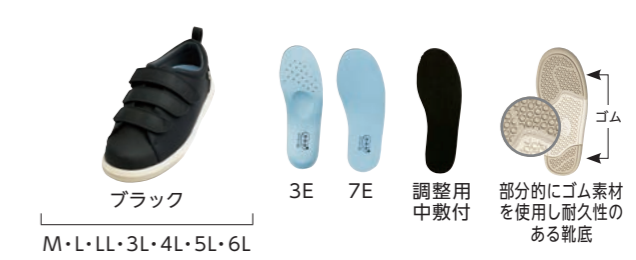
表:合成皮革 内:ポリエステル100% 底材:EVA樹脂/ゴム 重さ(片方LLサイズ):[3E]約315g [7E]約320g

標準幅 品番 7504 両足 10,780円 (税抜9,800円) 足囲 3E 片方のみ 5,390円 (税抜4,900円) 幅広タイプ 品番 7505 装具側足囲 7E 片方のみ 6,270円 (税抜5,700円)